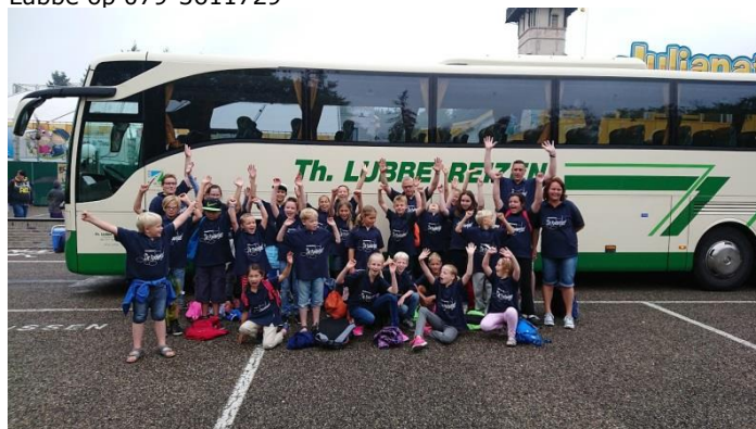
Foto van het jaarlijkse uitje van De Rokkertjes.