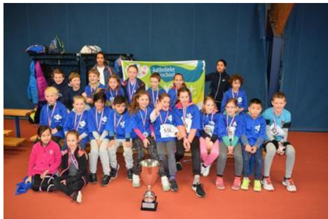
Winnen we weer de wisselbeker???