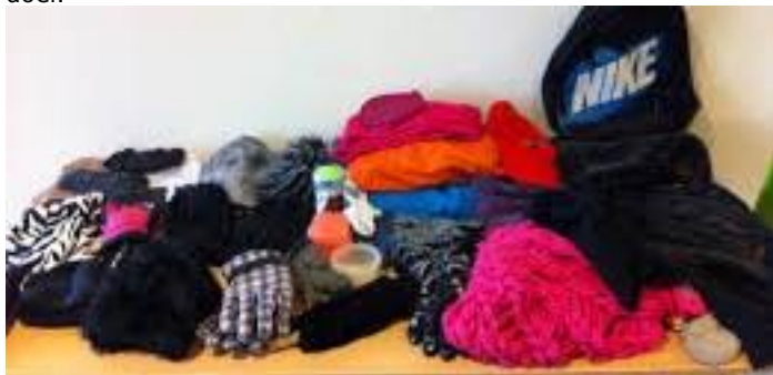
Namens de ouderraad, Petra Schippers

afgehaald zullen ter beschikking worden gesteld van een goed doel.