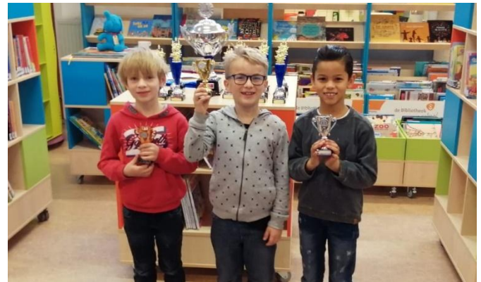
Op bovenstaande foto de winnaars van de groep 4.

Woensdag 20 februari zijn de prijzen uitgereikt aan alle deelnemers van het schoolschaaktoernooi. Vanuit de groepen 3 t/m 8 hebben hier 26 kinderen aan deelgenomen. Elke deelnemer kreeg een vaantje, er was een 1 ste , 2 de en 3 de prijs voor de winnaars van elke groep en de schoolkampioen kreeg de grote wisselbeker.